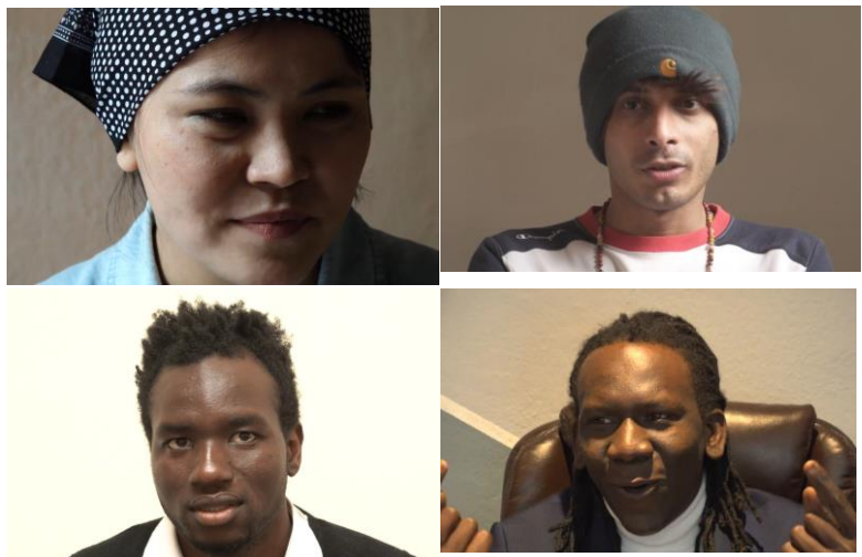
The four participants in the pilot action

Tutkimukseemme osallistui kolme miestä ja yksi nainen, jotka olivat nuoria aikuisia maahanmuuttajia eri maista – Kamerunista, Malista, Jemenistä ja Afganistanista – ja iältään 18–26-vuotiaita. He olivat saapuneet Italiaan Libyan ja Turkin kautta ja saaneet oleskeluluvan humanitaarisista syistä. Tutkimus-hetkellä kaksi nuorista asui tilapäisissä vastaanottokeskuksissa, kun taas yksi heistä oli päässyt muuttamaan yksityismajoitukseen.